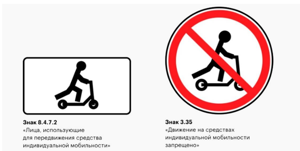
Рис. 5. Новые дорожные знаки

Для регулирования передвижения на СИМ появляются новые дорожные знаки. Так, к примеру, выглядит знак 8.4.7.2 «Движение лиц на средствах индивидуальной мобильности» и знак 3.35 «Движение на средствах индивидуальной мобильности запрещено» (рис. 5).